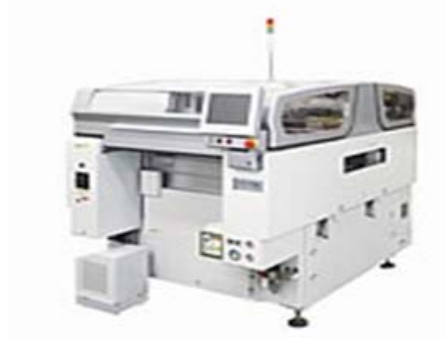
大型基板対応印刷機 日立 ΣP4