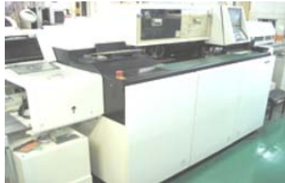
アキシャル挿入機 パナサート AVG/AVF

2.自動挿入設備 JV,AVG,RH2とLLサイズ基盤 対応します。 (RHU 7.5mmピッチ部品対応可能)