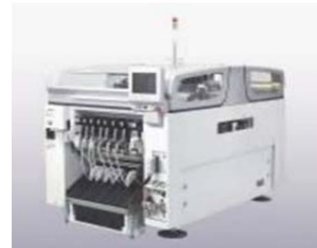
モジュールマウンター 日立 ΣG5