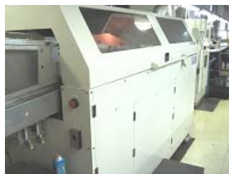
画像検査装置 日本電熱計器 ILM-350CM2