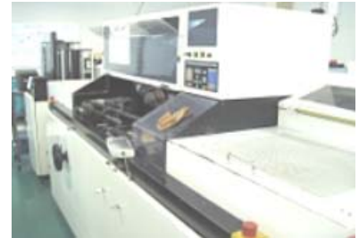
ラジアル挿入機 パナサート RH-2/3/6

3.画像検査装置 最新鋭 画像検査機 VQZ-FMA650 2台を導入し 5台にて対応