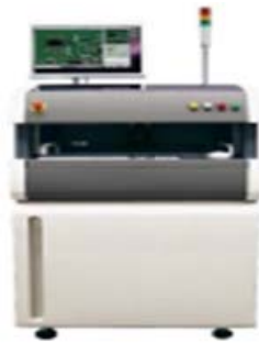
画像検査装置 日本マランツ VQZ-FMA650/DL520/VQZ3

3.画像検査装置 最新鋭 画像検査機 VQZ-FMA650 2台を導入し 5台にて対応