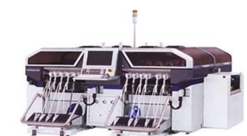
モジュールマウンター 日立 GXH-3