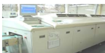
窒素式鉛フリーリフロー炉 エーテック NIS-20-82-C