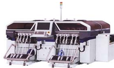
モジュールマウンター 日立 GXH-3