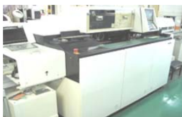
アキシアル挿入機 パナサート AVG/AVF