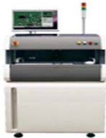
画像検査装置 日本マランツ VQZ-FMA650/DL520/VQZ3