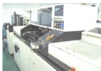
ラジアル挿入機 パナサート RH-2/3/6