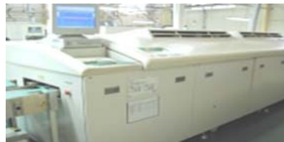
窒素式鉛フリーリフロー炉 エーテック NIS-20-82-C