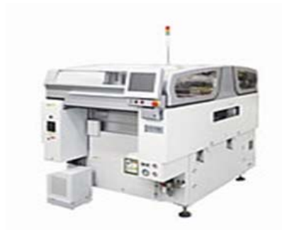
大型基板対応印刷機 日立 Σ P4